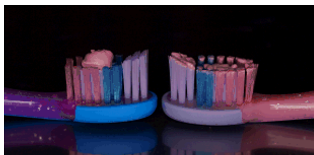
Ryc. 4. Śladowa ilość pasty (0,1 mg fluoru) i ilość pasty wielkości ziarna groszku (0,25 mg fluoru).