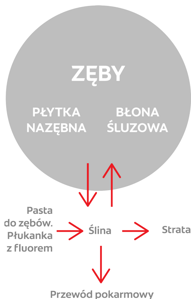
Ryc. 1. Losy jonów fluoru dostarczanych do jamy ustnej; szczególnie ważnym rezerwuarem jonów fluoru jest powierzchnia błony śluzowej jamy ustnej (wg Duckworth i Morgan w modyfikacji ten Cate).

Endogenna profilaktyka fluorkowa nie zmniejsza na stałe istotnie ryzyka choroby próchnicowej, natomiast nadmierne dostarczenie fluoru może być przyczyną fluorozy zębów. Korzystniejsze jest stosowanie metod egzogennych, zapewniających obecność fluoru w środowisku jamy ustnej po wyrżnięciu zębów. Losy fluorków dostarczanych do jamy ustnej przedstawia ryc. 1.